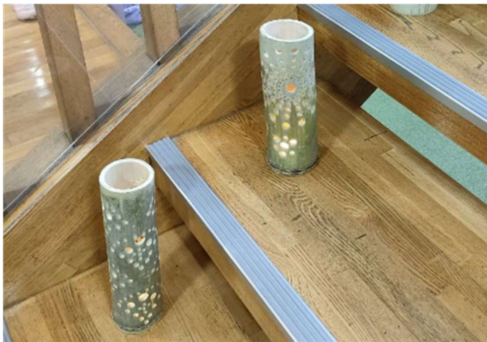
七二会里山整備利用推進協議会 （竹の会） 「竹ランタンづくり」

地域・企業・団体等の皆様のご協力をいただきながら、活動や環境の充実を図り、子どもの社会的自立を目指す。